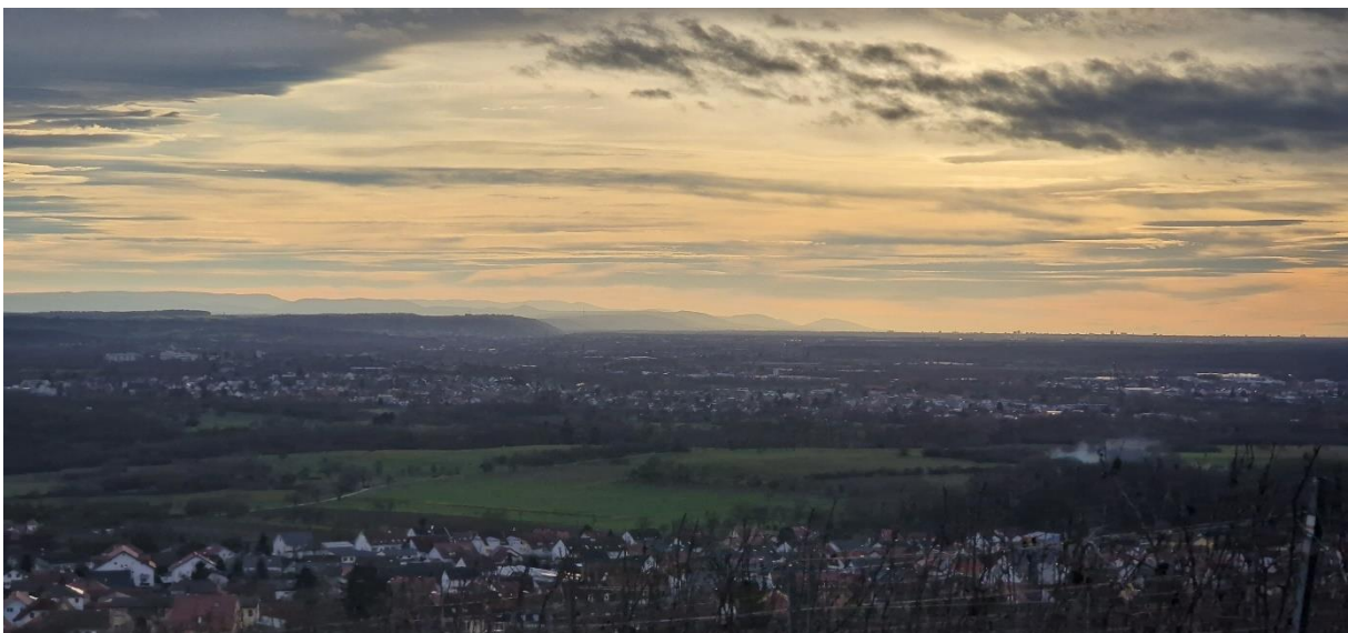
Blick vom Letzenberg, km 128 auf den Pfälzer Wald.